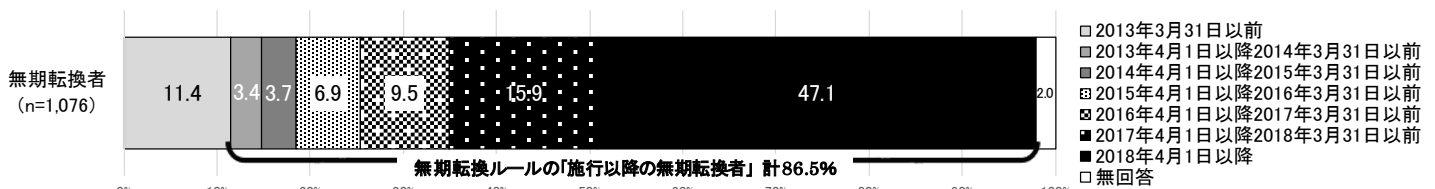
図表 13 無期転換の時期

なお、「無期転換者」(n=1,076)のうち、リーマンショック(2008年秋)当時に、有期契約労働者として「働いていた」割合は40.5%で、「2013年4月以降の無期転換者」(n=931)に限ると41.4%となった。