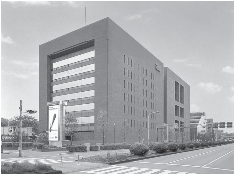
住友スリーエム本社（東京・世田谷区）

ろうか。住友スリーエムでは、個人の職務責任をジョブグレードに反映することで、職務の役割や責任の重さが給与に見合う制度を組合員層にも導入している。組合員層のジョブグレードは五から九。グレード毎にレンジ幅があつて、その年々の目標達成度などの評価で昇給が決定する。大卒初任者はグレード七に位置づけられているが、旧一般職の女性社員はグレード五もしくは六に位置づけられてきた。今は総合職と一般職の区分を廃するとともに、女性社員の労働の質を向上させている。労組の要求も追い風となり、旧一般職の女性社員は徐々に七以上にグレードアップ。彼女たちがこなしていた補助