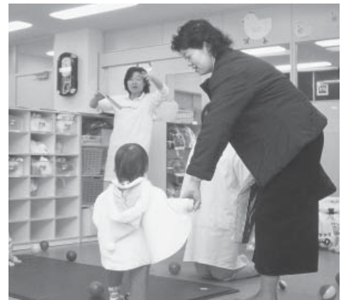
本文と写真は関係ありません

住友スリーエムは、自動車関連、電子機器関連、建築関連といった産業分野から生活関連、ヘルスケア分野まで幅広い分野に提供する化学メーカー。社員の斬新なアイデアをチームワークでまとめ上げて商品開発を重ね、世に送り出した製品は三万種を超える。開発には、高い技術力に裏打ちされた独創性ある人材が必要不可欠。このため、自由と規律を両立させて人材育成を進めてきた風土と歴史を併せ持つ。例えば、研究職や技術職は労働時間