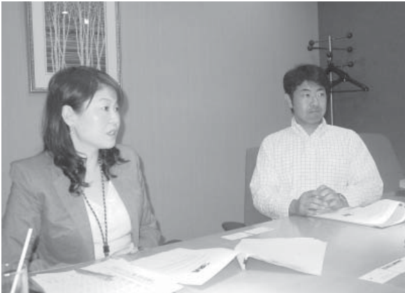
坂下人事支援部主任(左)と小山中央書記長