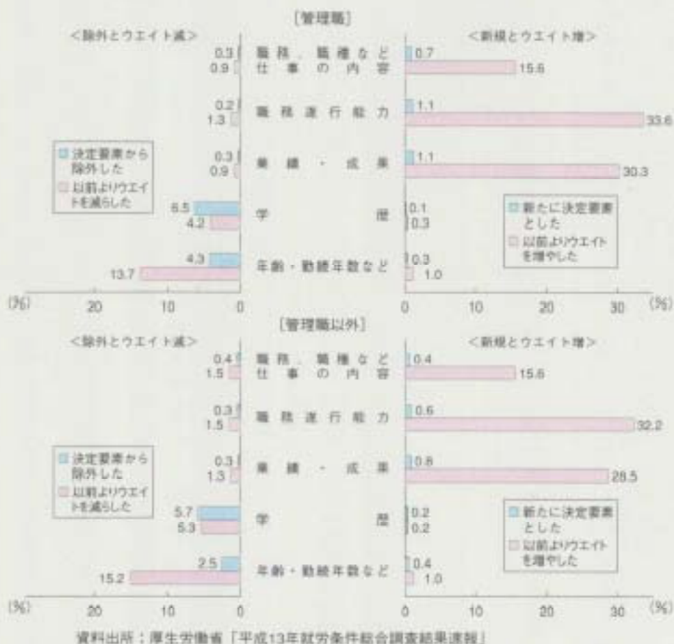
図表10 基本給の決定要素の過去5年間のウエイトの変化別企業数割合