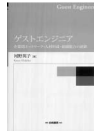
●白桃書房 2009年1月刊 A5判・276頁・3885円 (税込)

トワークに関する文献レビューがなされる。そこでは企業間ネットワークの中で技術者に要求される能力や人材形成システムのあり方を明確に論じたものはないとする。第3章「分析の進め方」では分析枠組みとその対象、単位などが示される。分析枠組みは人材形成