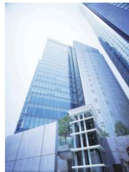
本社ビル(東京都港区)