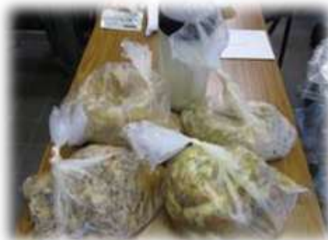
放射能検査後の無残な検体