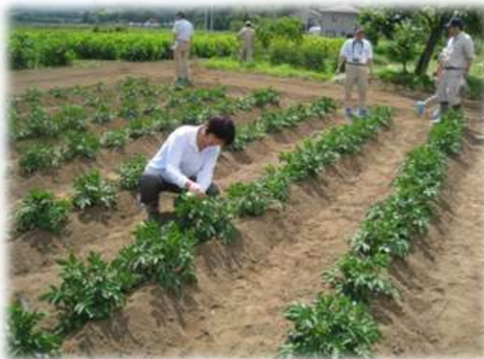
種芋生産の第1期検査 ばれいしょ植物防疫補助員の仕事