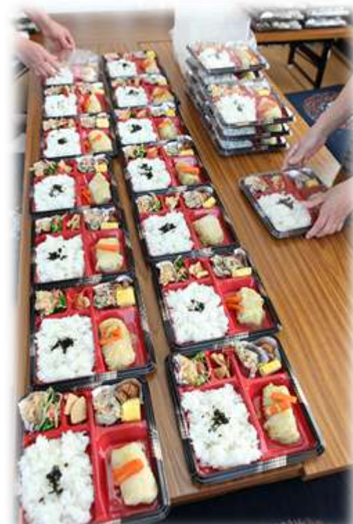
かーちゃん弁当の研究開発 (2012年5月)