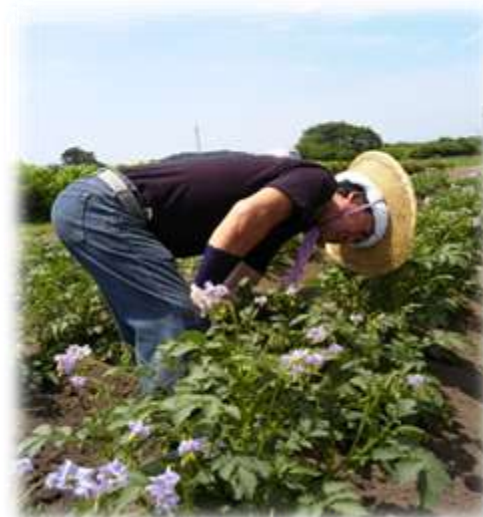
夫の理解が一番の原動力