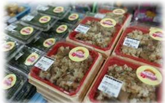
増える新商品 (2012年5月)