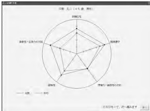
図表4-3 「心の硬さ」結果の例